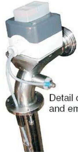
Detail of and em

В комплект поставки входит компрессор А 1.5 Н.Р., выполняющий пневматическое открытие и закрытие клапана. Оборудование также оснащено дополнительным пистолетом для дозирования бочек. Бочки могут заполняться как насосом подачи, так и самотеком, без осуществления каких-либо модификаций. Насос подачи не включен в поставку. При использовании насоса, он должен быть подключен к распределительному щиту и